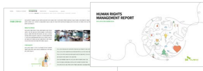
2022년 SK이노베이션 계열 인권경영보고서